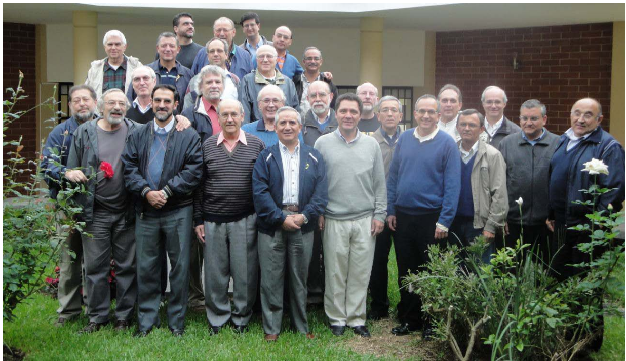
Provinciales participantes en la XXª reunión de la CPAL en Guatemala

Guatemala, en la solemnidad de la Santísima Trinidad.