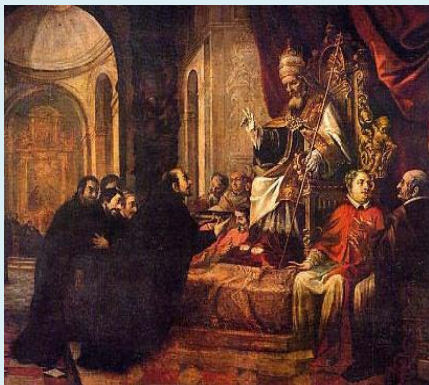
Aprobación de la Compañía de Jesús por Paulo III 27 -09-1540